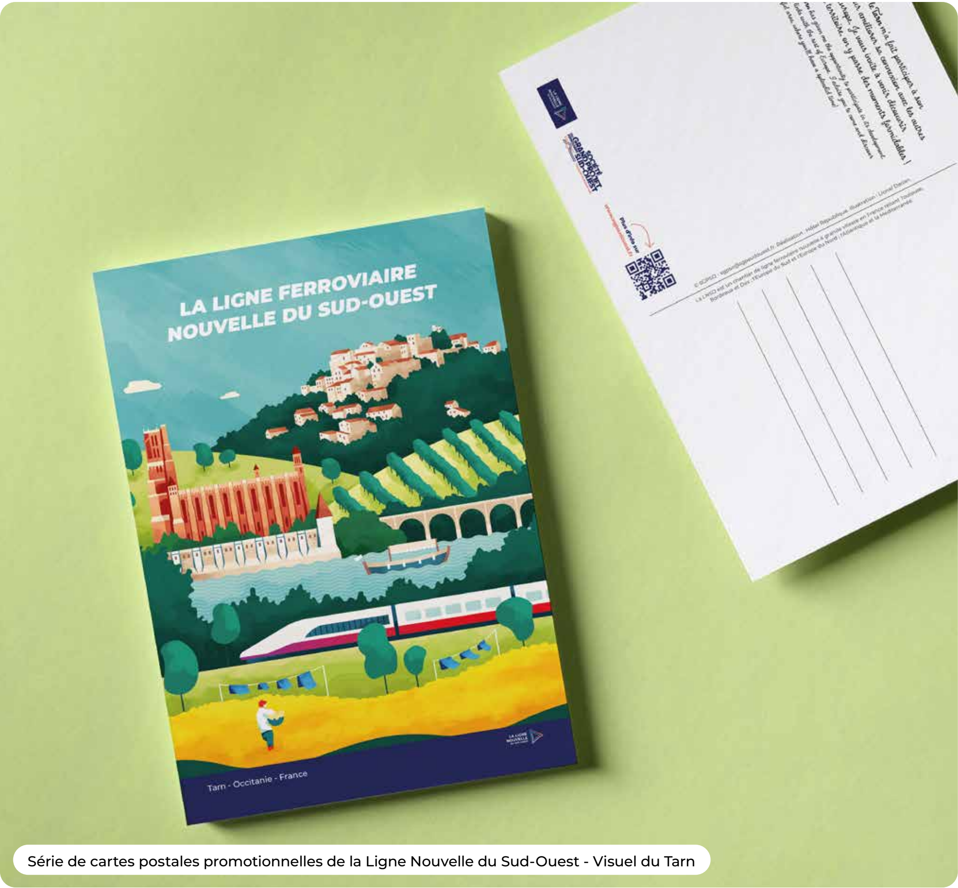
Série de cartes postales promotionnelles de la Ligne Nouvelle du Sud-Ouest - Visuel du Tarn