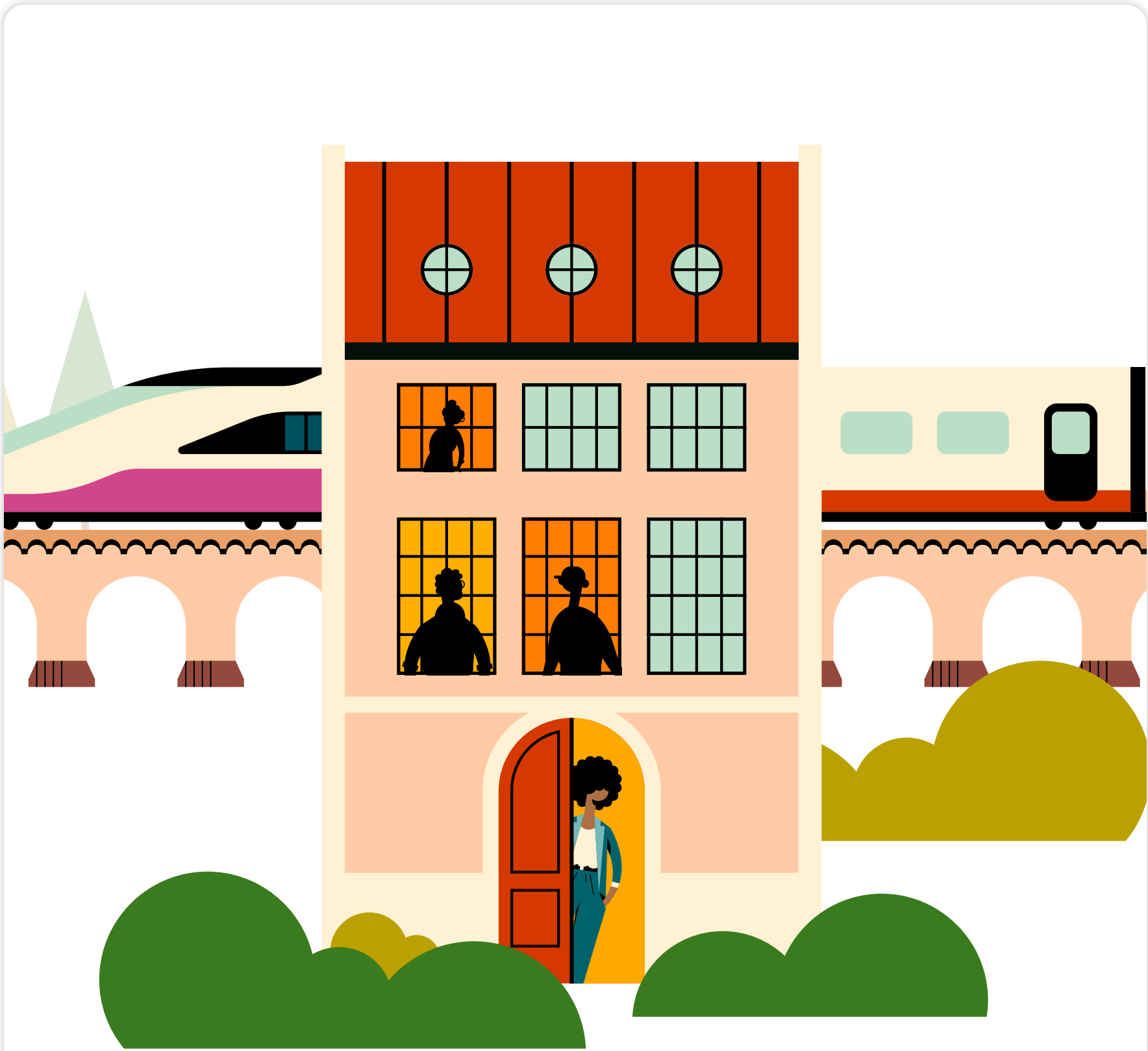
Extrait du Motion Design « Persona »