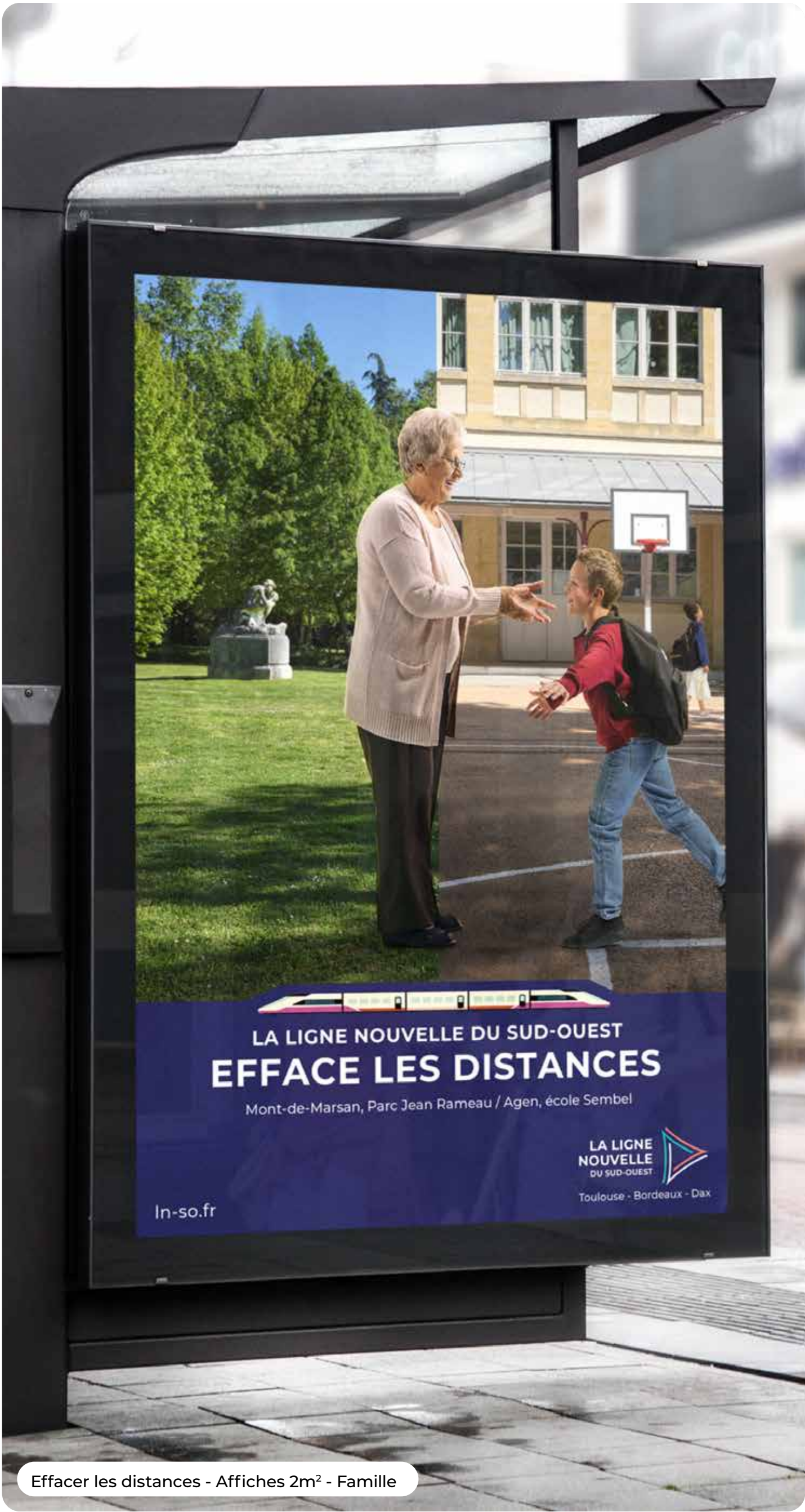
Effacer les distances - Affiches 2m² - Famille