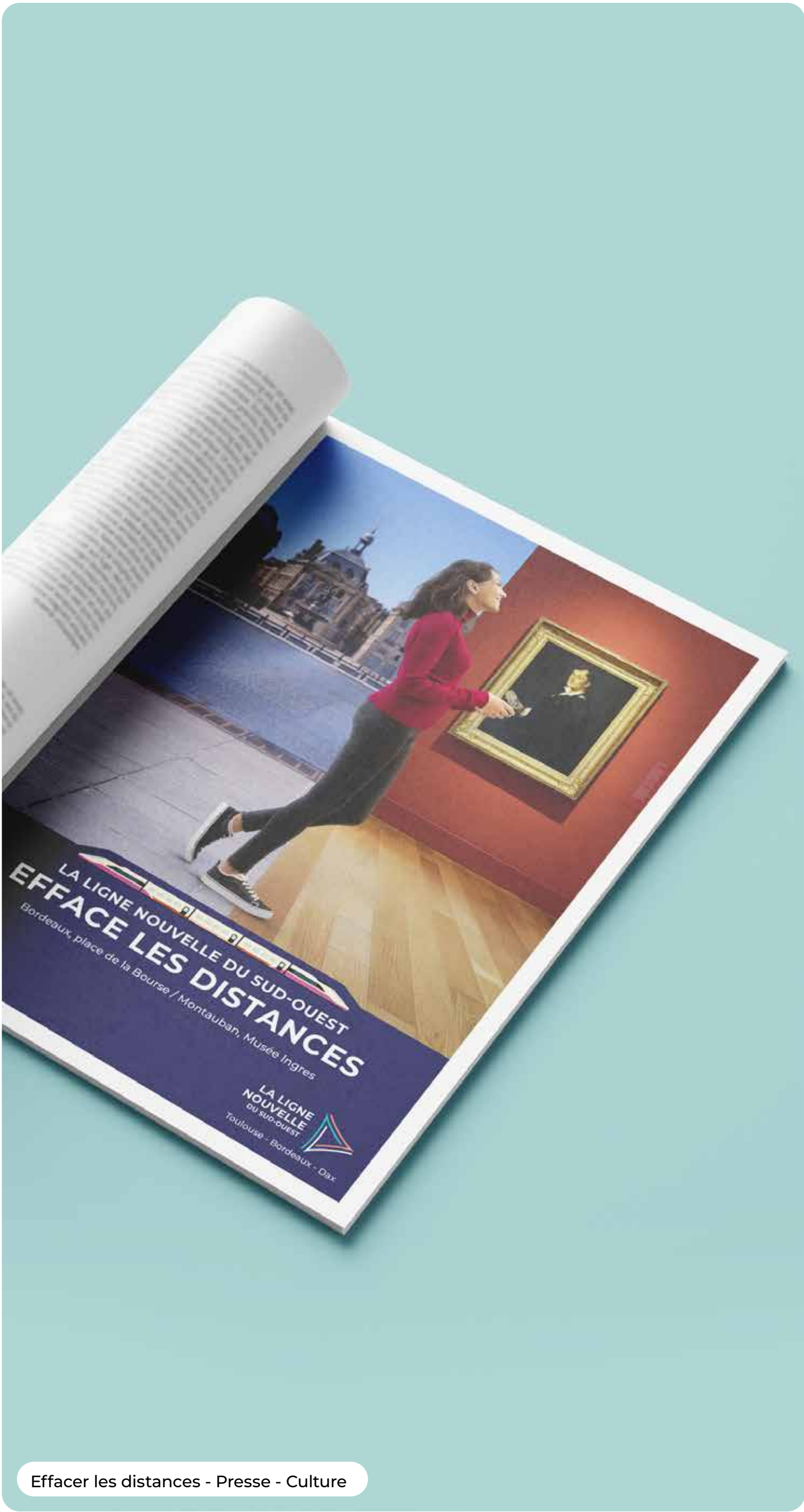
Effacer les distances - Presse - Culture