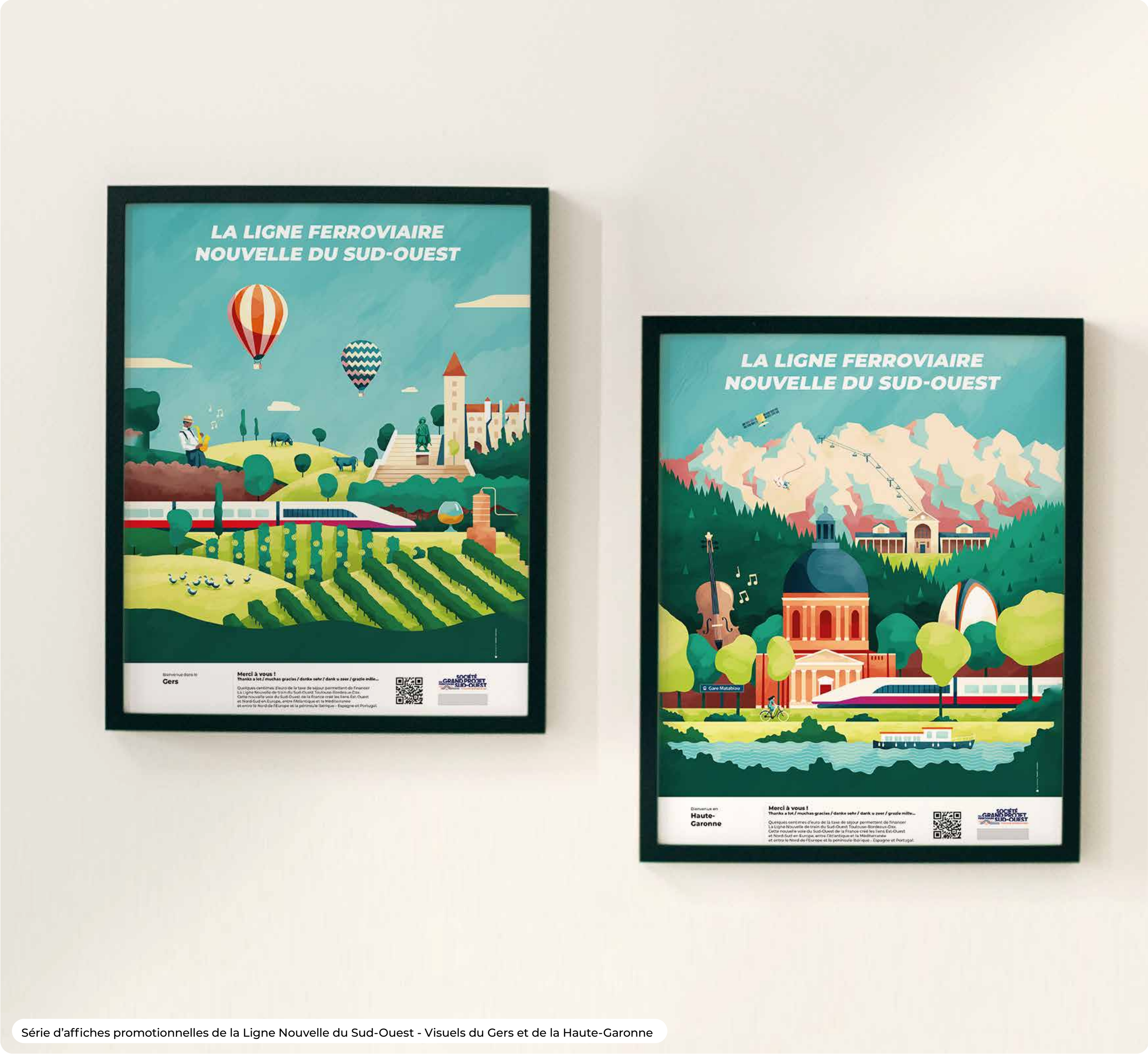
Série d'affiches promotionnelles de la Ligne Nouvelle du Sud-Ouest - Visuels du Gers et de la Haute-Garonne