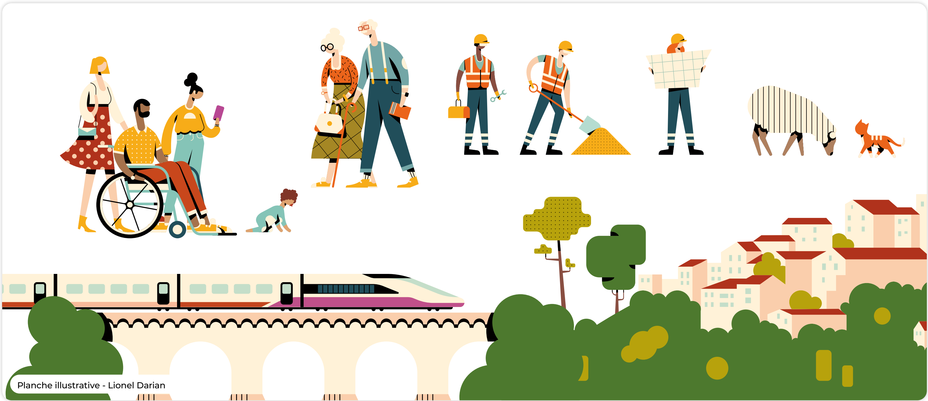
Planche illustrative - Lionel Darian