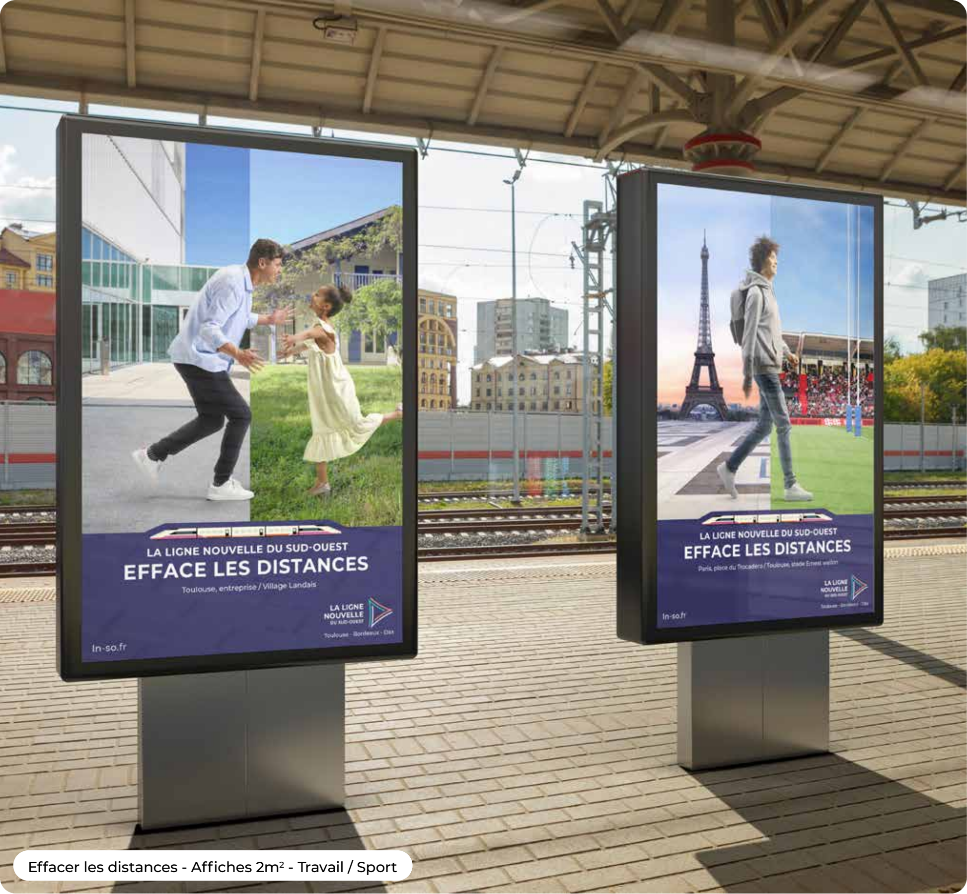
Effacer les distances - Affiches 2m² - Travail / Sport