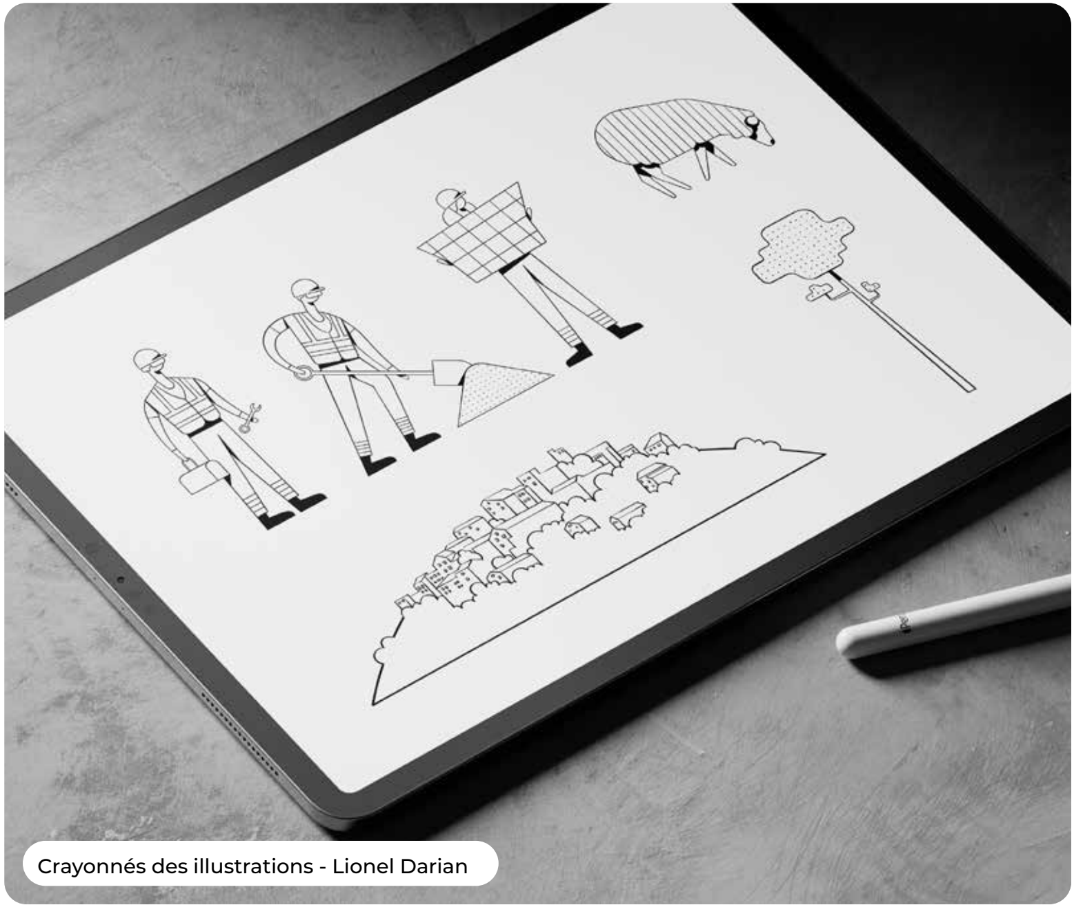
Crayonnés des illustrations - Lionel Darian