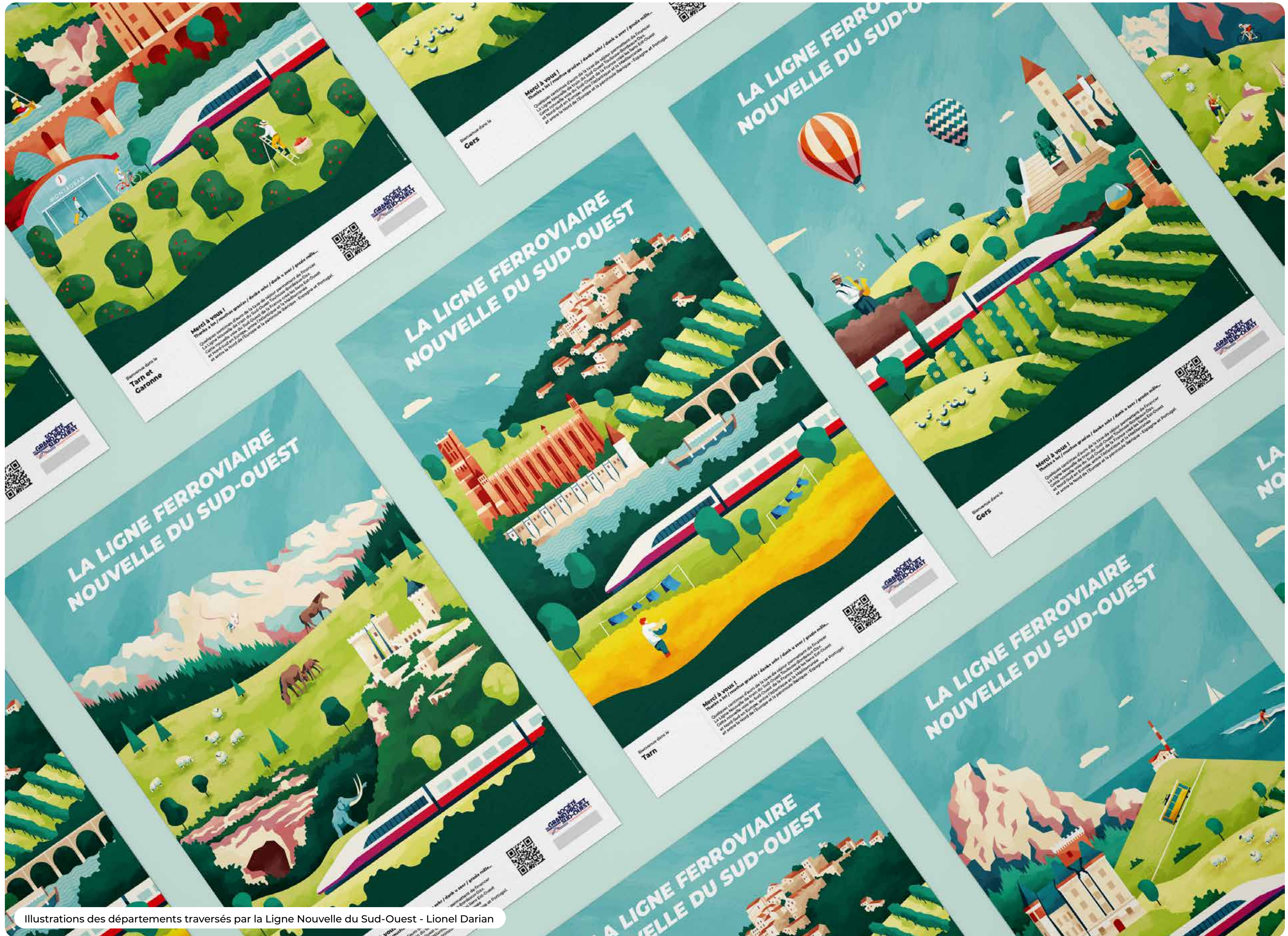
Illustrations des départements traversés par la Ligne Nouvelle du Sud-Ouest - Lionel Darian